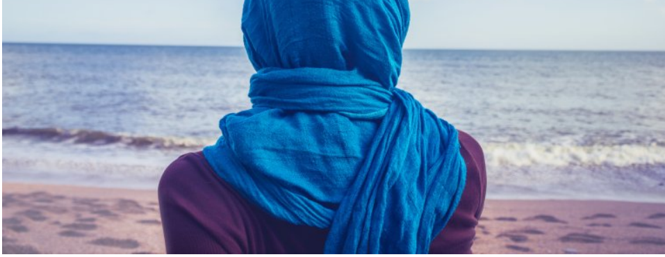
Illustrasjonsfoto; Adobe Stock.

Dahl (9) beskriver at det kulturelle kartet flyktninger har med seg fra hjemlandet, ikke stemmer overens med det nye terrenget. Plutselig forandrer livssituasjonen seg, og alt det gamle er uten betydning i det nye landet. Felles for flyktninger er at de bevisst eller ubevisst har sin fortid og sine gamle kulturelle spilleregler med seg. De har med seg en usynlige bagasje av et verdensbilde med sine sett av normer og verdier som de oppfatter som naturlige og riktige. Dette kan for eksempel få betydning for deres vurdering av hvordan forholdet mellom barn og voksne skal være og hvordan mann og kvinne skal oppføre seg mot hverandre.