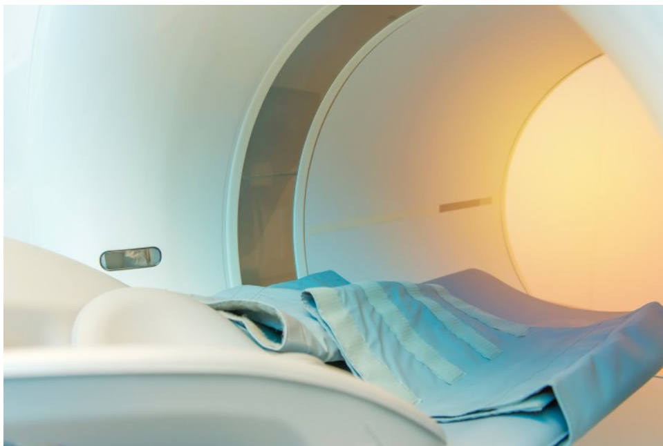
CT-maskin.