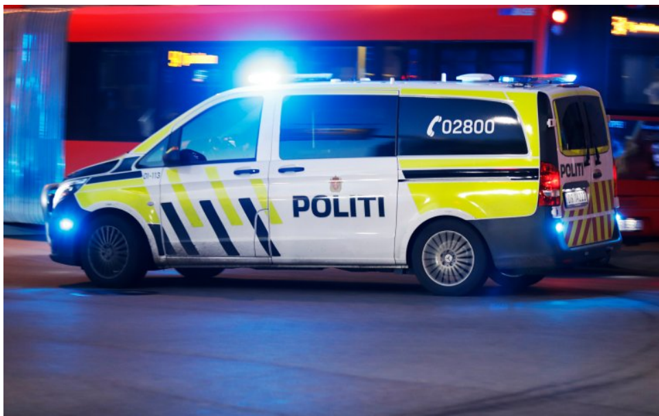
Illustrasjon. NTB/Erik Johansen

Vi ser at i spesialisthelsetjenesten brukte både DPS, AMK og ambulansetjenesten til dels store ressurser på Malin. To forskjellige helseforetak var også involvert i oppfølgingen. I kommunehelsetjenesten ble det brukt ressurser på tjenestetilbudet i bolig og konsultasjoner på legevakten i tillegg til ukentlige samtaler hos fastlegen. Politiet var involvert fra ungdomsårene, men ressursbruken økte betydelig det siste halvåret Malin levde.