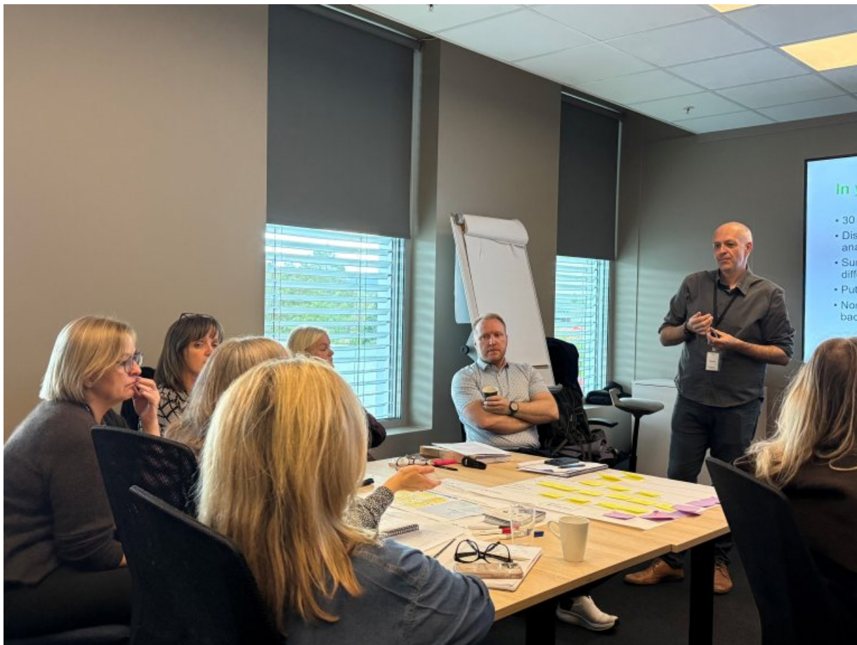
Kurs i metodikk ved vår engelske søsterorganisasjon HSSIB, september 2025.