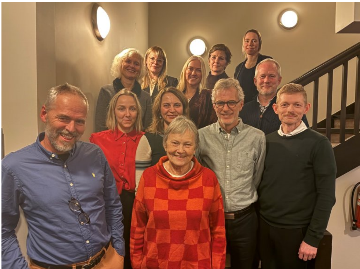
Refleksjonspanelet til Ukom desember 2025.

Det gjennomføres to heldagssamlinger med refleksjonspanelet hvert år, vår og høst. Refleksjonspanelet har gitt grundige og verdifulle innspill til alle undersøkelsene våre. Disse tilbakemeldingene gis skriftlig eller i egne møter.