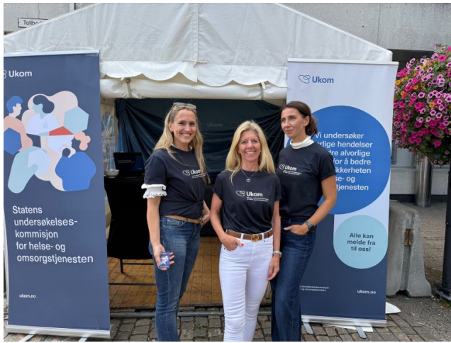
Ukom på stand på Arendalsuka 2025.

Ukom deltar i det internasjonale nettverket International Patient Safety Investigation Bodies (IPSON), som består av ikkesanksjonerende aktører fra hele verden. I 2025 ble det holdt seks møter i nettverket. Ukom deltok på alle.