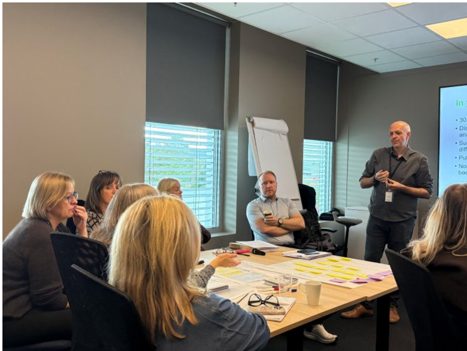
Kurs i metodikk ved vår engelske søsterorganisasjon HSSIB, september 2025.

For å bygge denne kompetansen har vi sendt medarbeidere på kurs i regi av HSSIB og NHS i England. I tillegg har vi hatt fagpersoner fra HSSIB på besøk hos oss i Norge for å gjennomføre et tre dagers kurs for alle ansatte i Ukom. Dette har gitt oss en felles metodisk plattform og styrket kvaliteten på arbeidet vårt ytterligere.