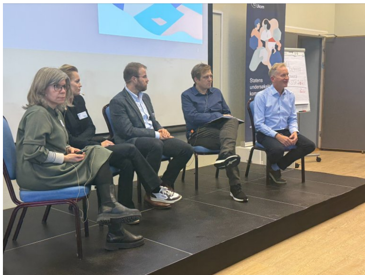
Paneldebatt om ny meldeordning på Ukom-seminaret desember 2025.

Dialog- og forankringsmøter med relevante aktører er en sentral del av vår sikkerhetsfaglige undersøkelsesmetode. Vi holder slike møter gjennom hele undersøkelsesprosessen. Her drøfter vi funn og anbefalinger med fagfolk, helseledere, pasient- og brukerorganisasjoner, yrkesorganisasjoner, forskere og fagmiljøer som blir berørt av undersøkelsene våre. Slik får vi viktige innspill til forbedringsområder både på tjeneste- og sektornivå. Dette bidrar til at rapportene våre er relevante og nyttige, og at anbefalingene treffer godt.