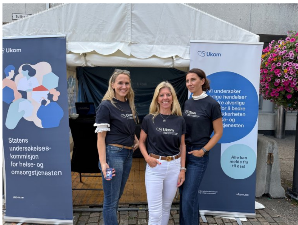
Ukom på stand på Arendalsuka 2025.

Vi bidro også på internasjonale konferanser, webinarer og andre læringsarenaer knyttet til uavhengige sikkerhetsfaglige undersøkelser for bedre pasientsikkerhet i løpet av 2025. Det er stor internasjonal interesse for Ukoms arbeid og for konseptet med uavhengige granskinger for læringsformål i helse- og omsorgstjenesten.