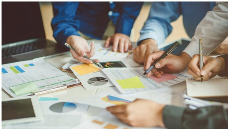
SYSTEMPERSPEKTIV I GJENNOMGANGER AV ALVORLIGE UØNSKEDE HENDELSER

Rapporten viser at det er variasjon både i kompetanse og hva slags ressurser virksomhetene har for arbeidet. Mange opplever slike gjennomganger som krevende, og det kan være vanskelig å involvere alle berørte parter. Helse- og omsorgstjenestene har en lovfestet plikt til å gjennomgå disse for å forebygge tilsvarende hendelser. Målet med slike hendelsesgjennomganger er å skape organisatorisk læring for å styrke pasientsikkerheten.