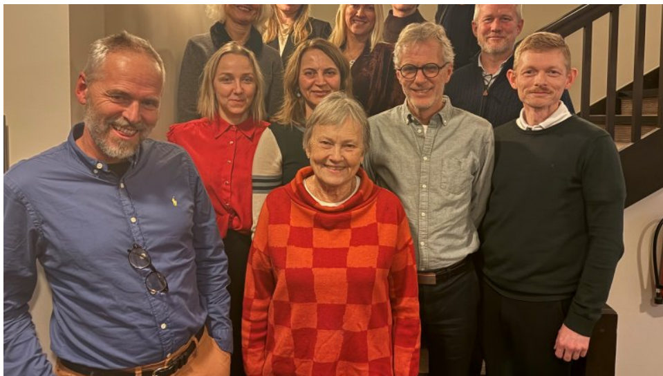
Refleksjonspanelet til Ukom desember 2025.