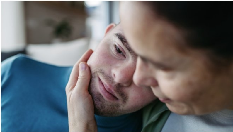
HVEM FORSTÅR MEG?

Rapporten viser at det er behov for økt kompetanse om utviklingshemming i helse- og omsorgstjenesten. Det er også behov for tydeligere føringer for ledsagerordningen ved sykehusinnleggelse.